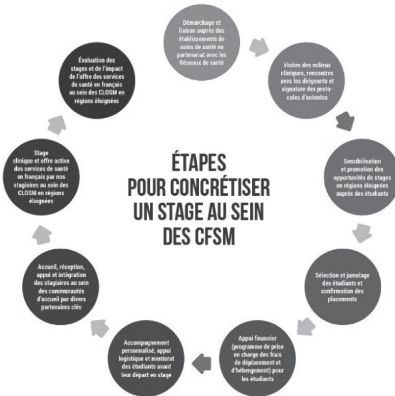
Schéma 1 — Étapes pour concrétiser un stage au sein des CFSM

Le cheminement élaboré et présenté dans le schéma 1 ci-après expose les différentes étapes habituellement suivies par l'équipe du CNFS et ses partenaires. Celles-ci ont favorisé, et favorisent encore, la concrétisation de stages au sein des CFSM.